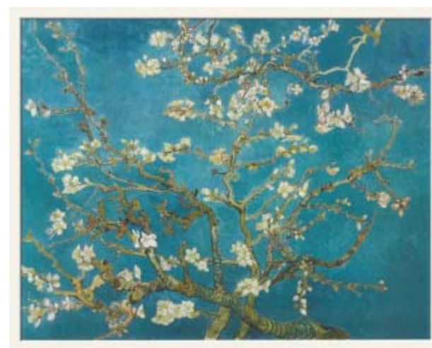
*Van Gogh, Mandorlo in fiore